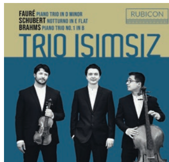
Fauré, Schubert, Brahms Trio Isimsiz RCD1048