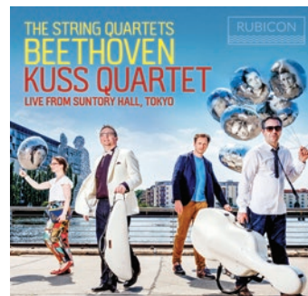
Beethoven: The Complete String Quartets Kuss Quartet RCD1045